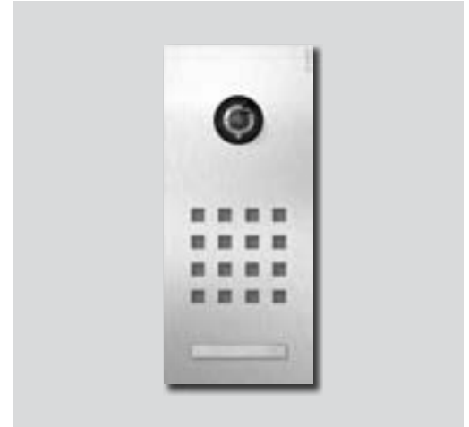
Uitvoeringen met voorbeelden