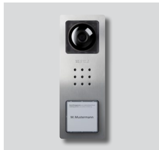
Exempel på utföranden