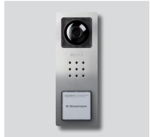
Eksempler på forskellige typer