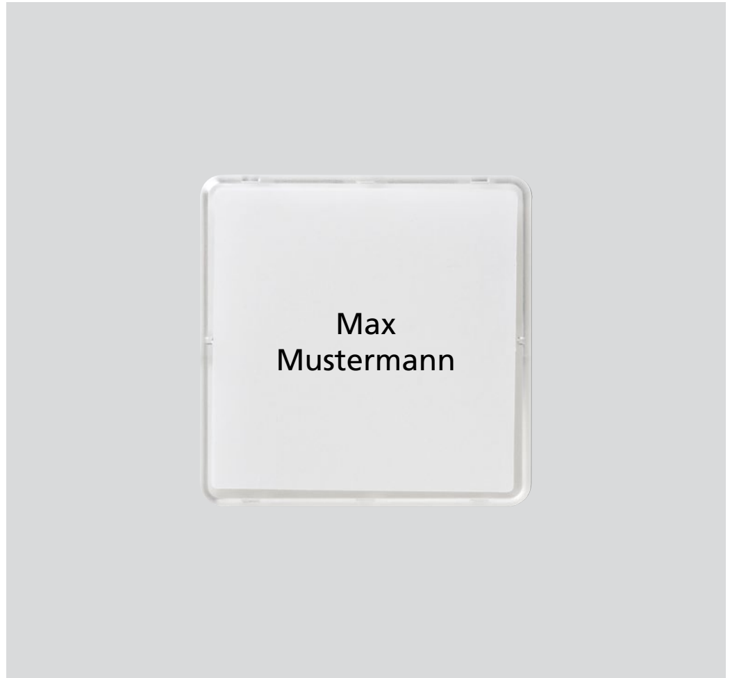
Original skrift, original størrelse