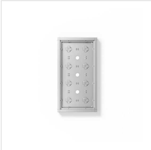
Gehäuse-Aufputz GA 612-4/2-01 SM