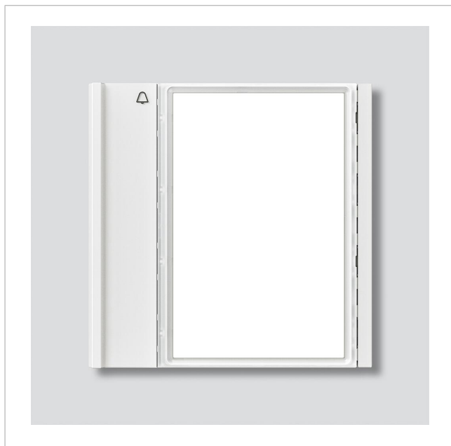
Tasti di chiamata per Siedle Vario TM 700-1-0 W 210011966-00