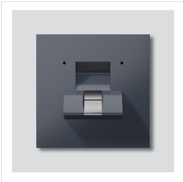
Fingerprint module FPM 600-0 AG 210009608-00