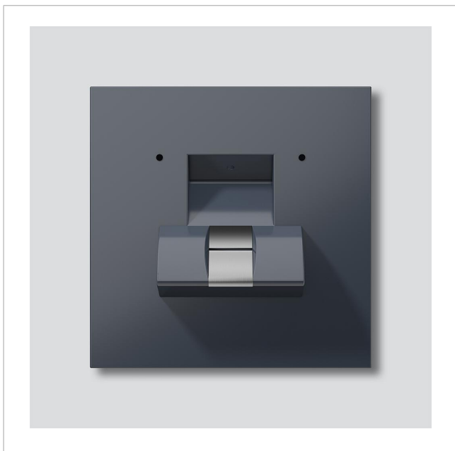
Modulo Fingerprint FPM 600-0 AG