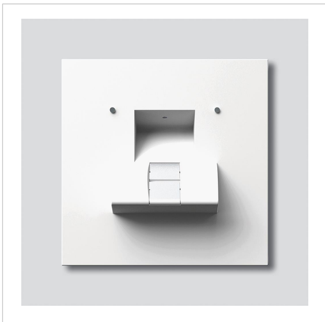
Fingerprint module FPM 600-0 W 210009607-00