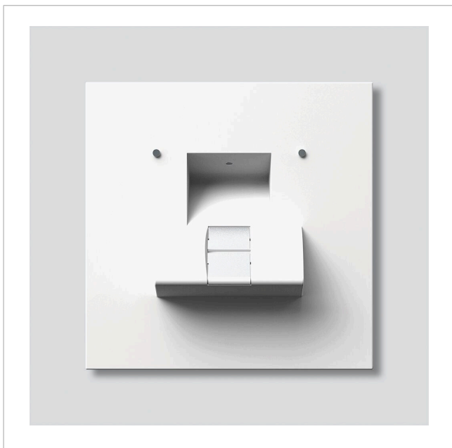
Fingerprint module FPM 600-0 W 210009607-00