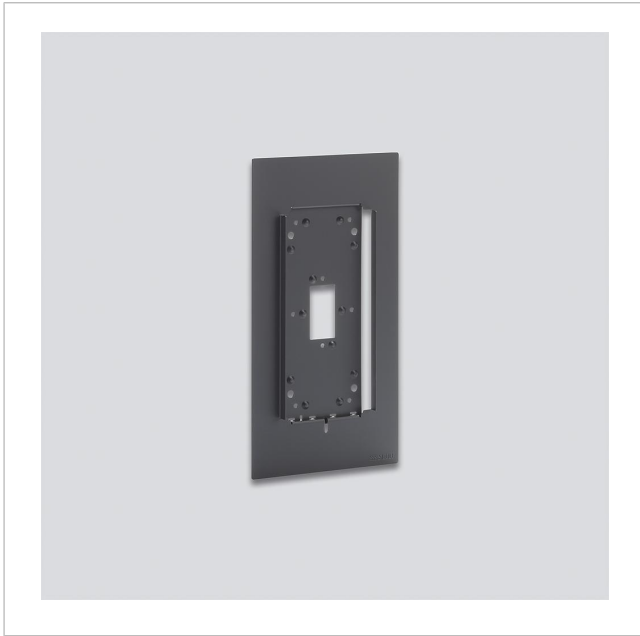
Eftermonteringspanel Hustelefon HT/NB 800-0 S 210008890-00