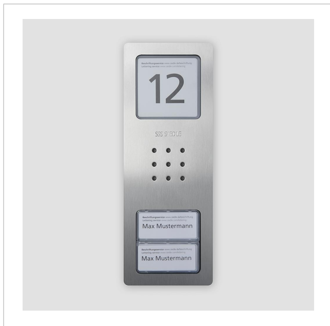
Platine de rue audio Siedle Compact CA 812-2 E