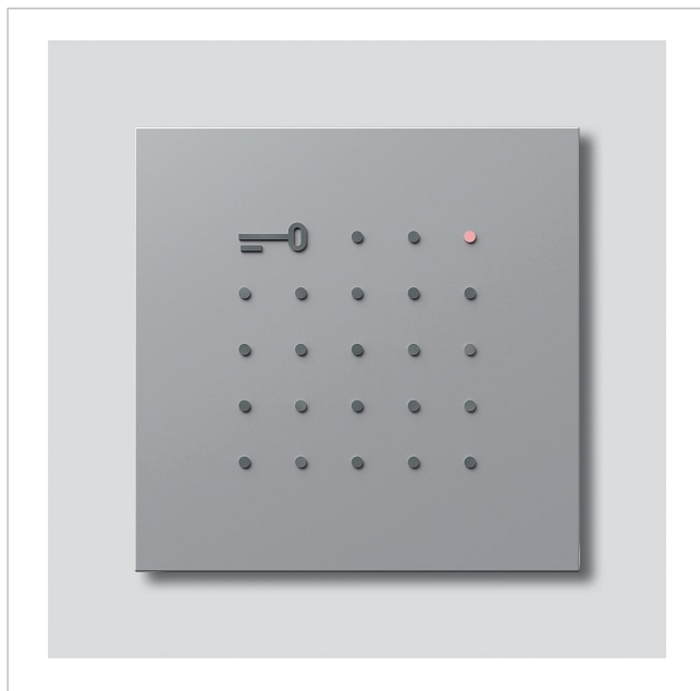
Electronic Key leesmodule ELM 600-0 SM 210008428-00