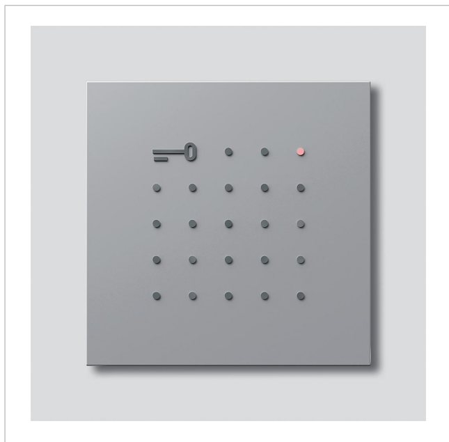
Modulo di lettura Electronic Key ELM 600-0 SM 210008428-00