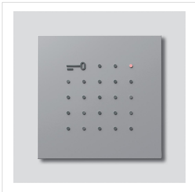
Module lecteur de clef électronique ELM 600-0 SM 210008428-00