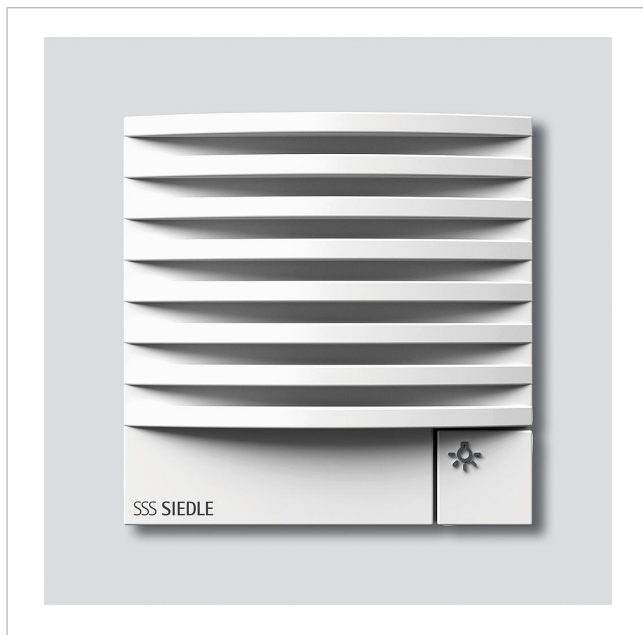
Modulo porter Access Plus ATLM 671-0 W 210007344-00