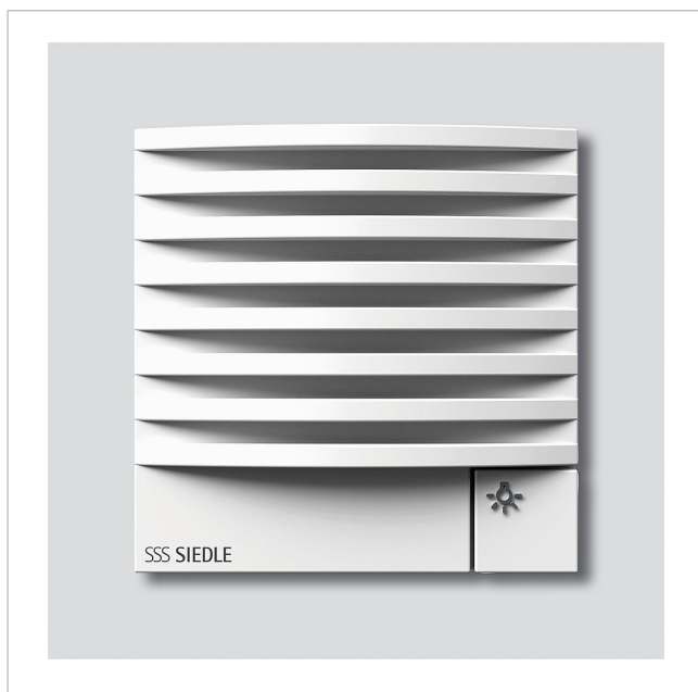
Module haut-parleur de porte bus Plus BTLM 651-0 W