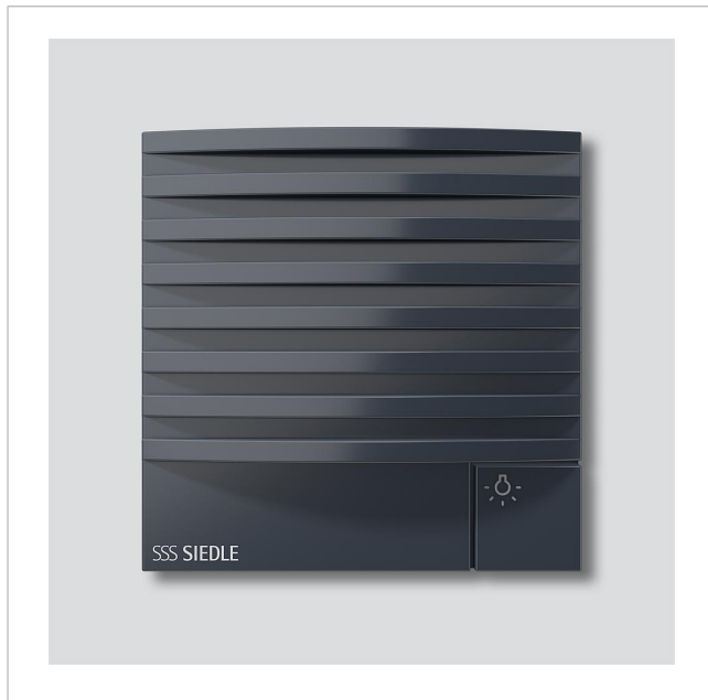
Deurluidsprekermodule Multi TLM 645-02 AG 210006366-00