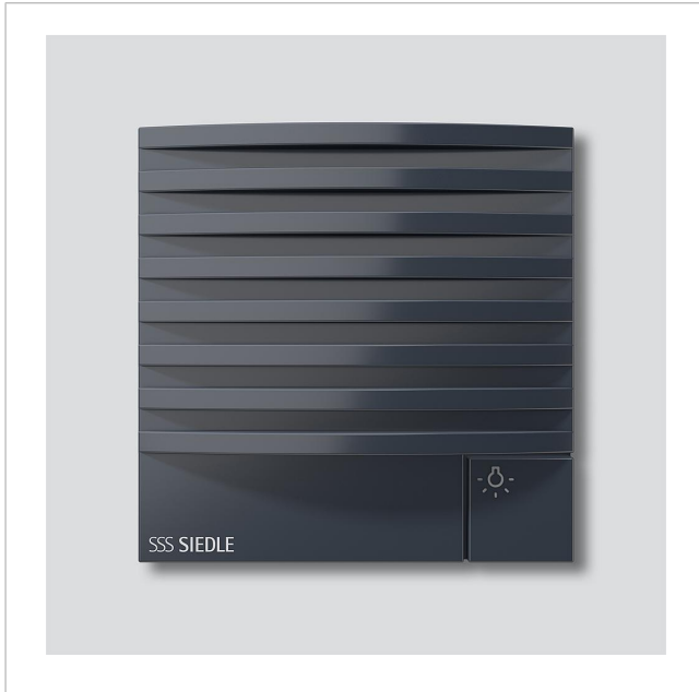
Dørhøjtalermodul Multi TLM 645-02 AG 210006366-00