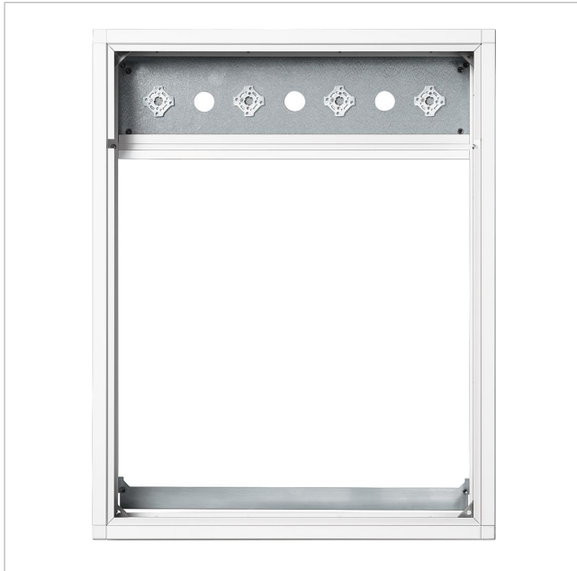
Cadre combiné KR 614-1/1 AG