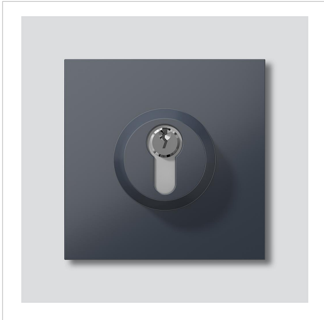
Slot-module SM 611-01 AG 210004992-00