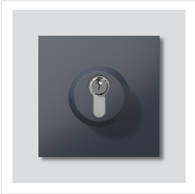
Schloss-Modul SM 611-01 AG 210004992-00