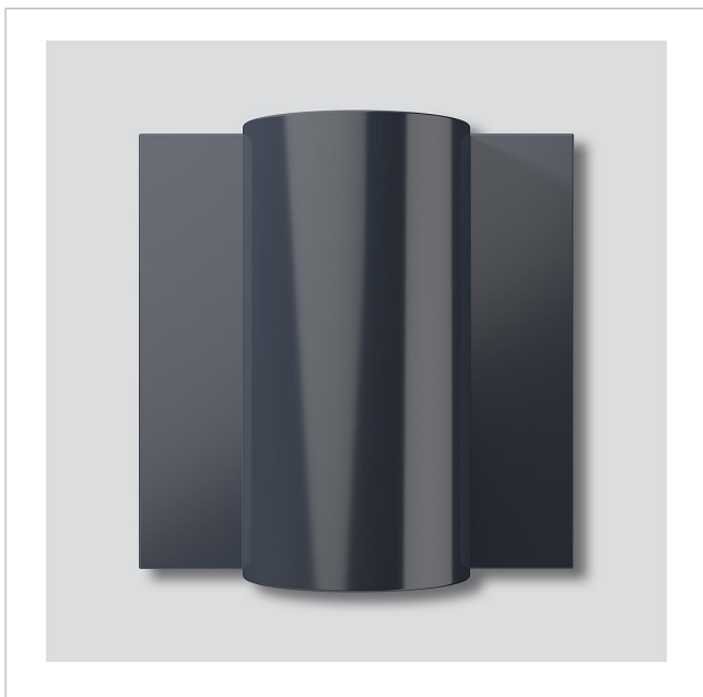
LED-Spot LEDS 600-0 AG 210004990-00