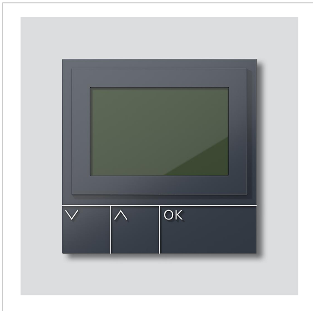
Module d'affichage d'appels DRM 612-02 AG 210004915-02