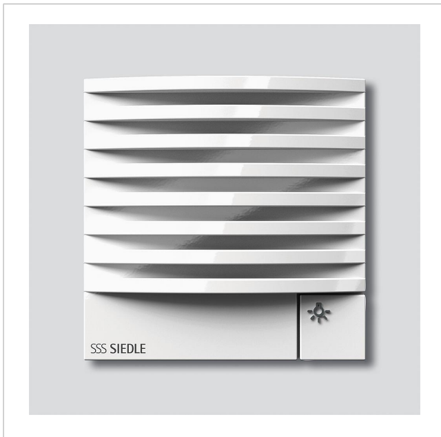
Türlautsprecher-Modul Line-Level TLM/LL 611-02 WH 200087689-00