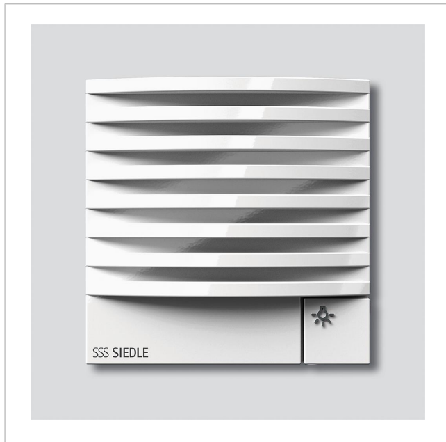
Module portier de rue Multi TLM 645-02 WH 200087685-00