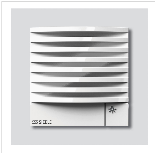
Türlautsprecher-Modul Multi TLM 645-02 WH 200087685-00