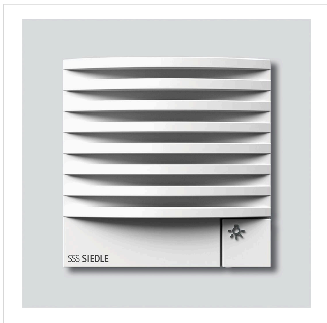
Module portier de rue Line-Level TLM/LL 611-02 W 200087580-00