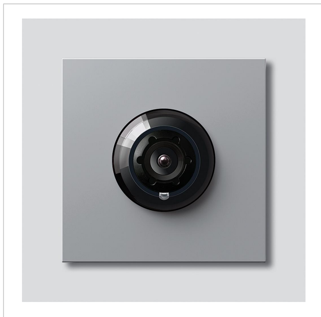
Caméra Access 180 pour Siedle Vario ACM 678-02 SM 200049326-01