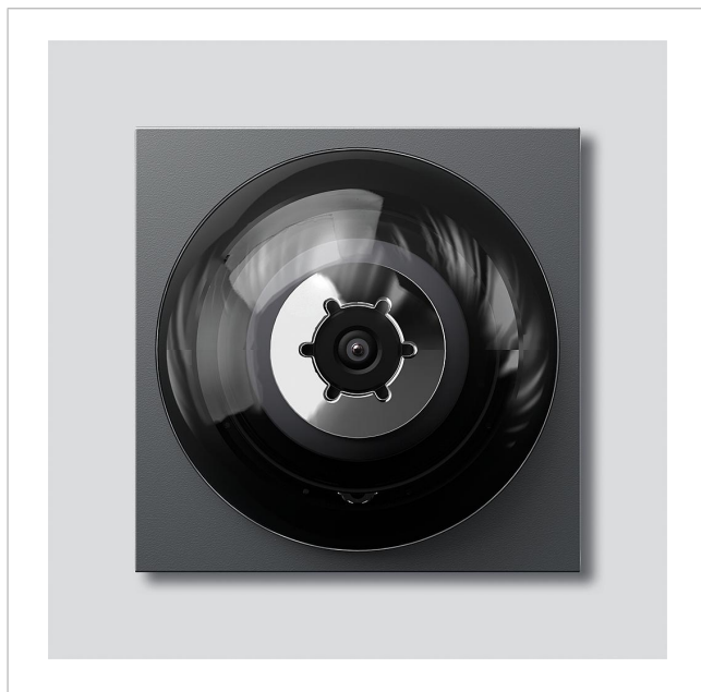
Access-kamera 80 til Siedle Vario ACM 670-03 DG 200049019-01