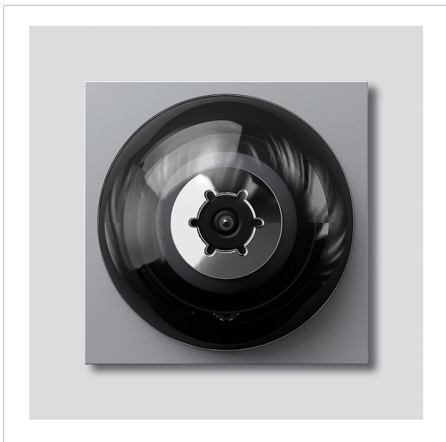
Access-kamera 80 til Siedle Vario ACM 670-03 SM 200049015-01