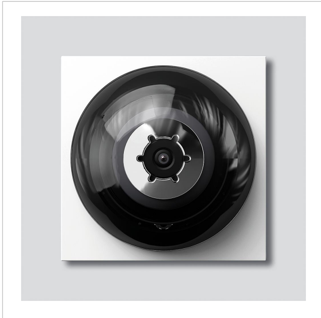
Access-Camera 80 voor Siedle Vario ACM 670-03 W 200049014-01