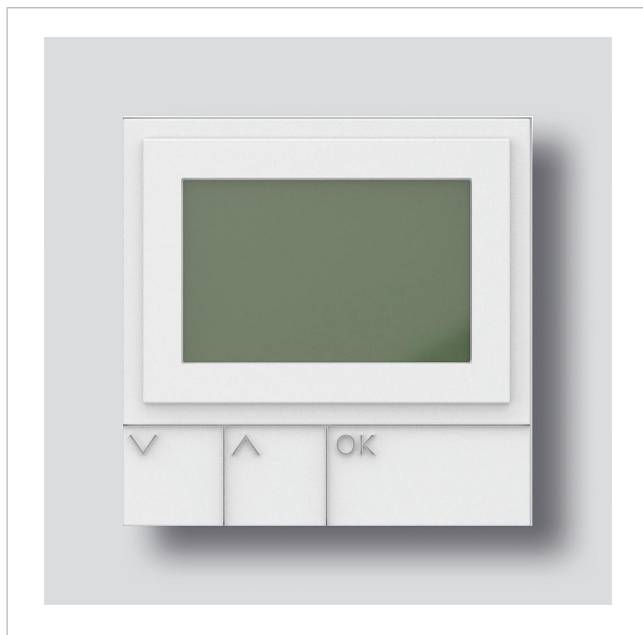
Module d'affichage d'appels DRM 612-02 W 200048756-02