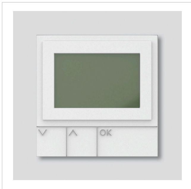
Display-Ruf-Modul DRM 612-02 W