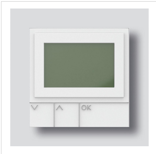
Display-Ruf-Modul DRM 612-02 W