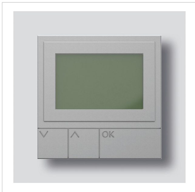
Display oproepmodule DRM 612-02 SM