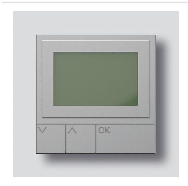
Modulo di chiamata a display DRM 612-02 SM 200048755-02