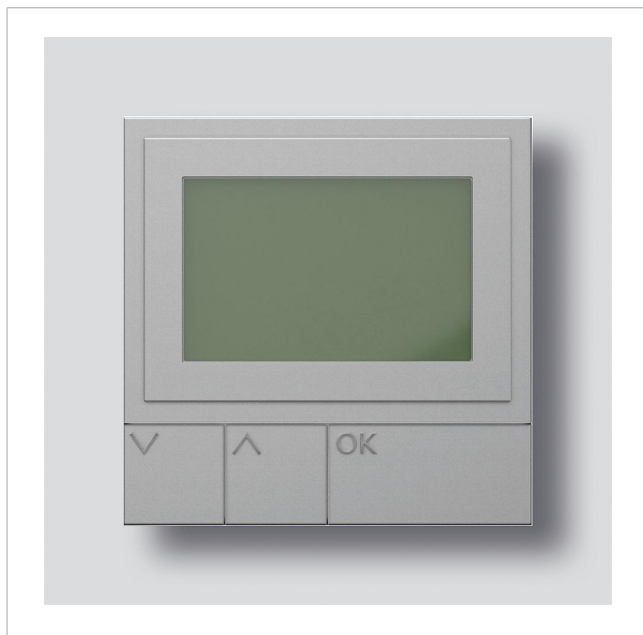
Module d'affichage d'appels DRM 612-02 SM 200048755-02