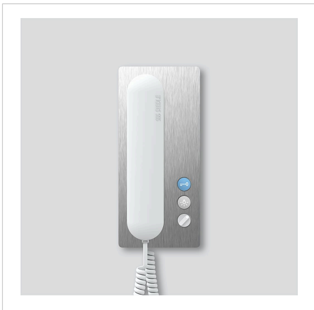
Citofono di sistema standard HTS 811-01 E/W 200044641-00