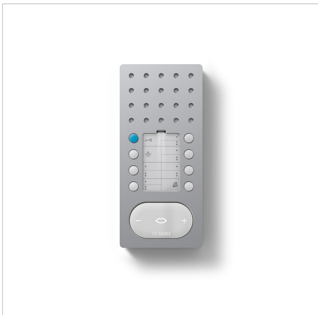
Buss-svarsapparat Comfort Intercom BFC 850-0 A/W