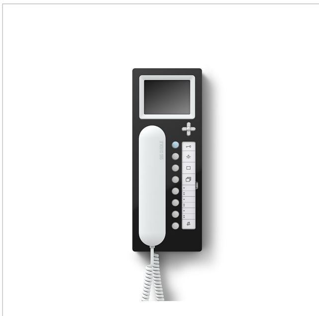
Access Combiné intérieur AHT 870-0 SH/W 200044581-00