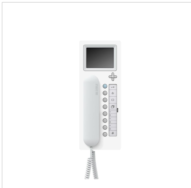
Access Combiné intérieur vidéo AHTV 870-0 WH/W 200044452-00