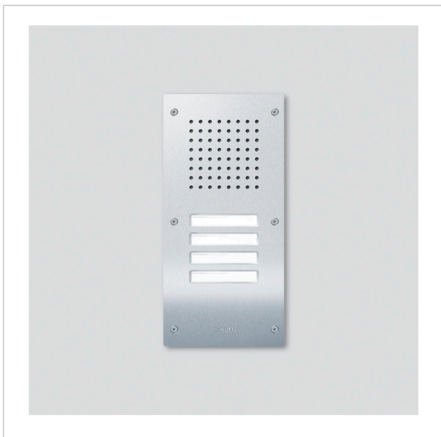
Platine de rue Siedle Classic Audio CL 111-4 R-02 200042894-00