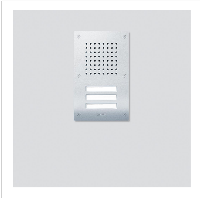
Platine de rue Siedle Classic Audio CL 111-3 N-02 200042887-00