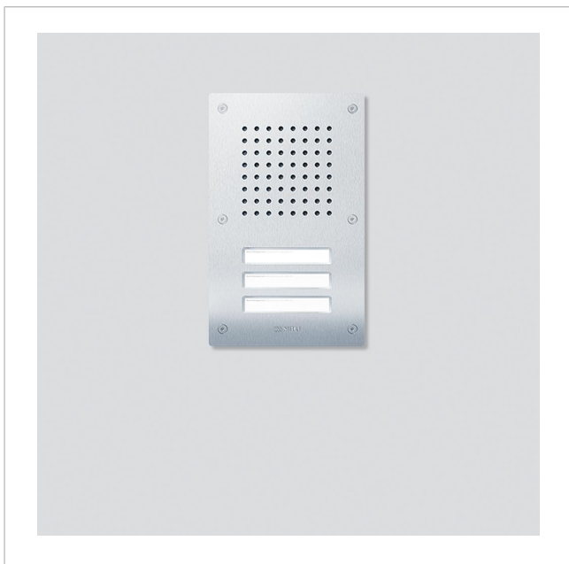
Platine de rue Siedle Classic Audio CL 111-3 B-02 200042881-00