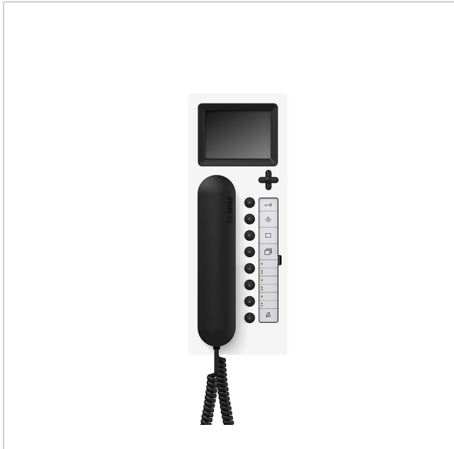
Access Haustelefon Video AHTV 870-0 WH/S 200041946-00