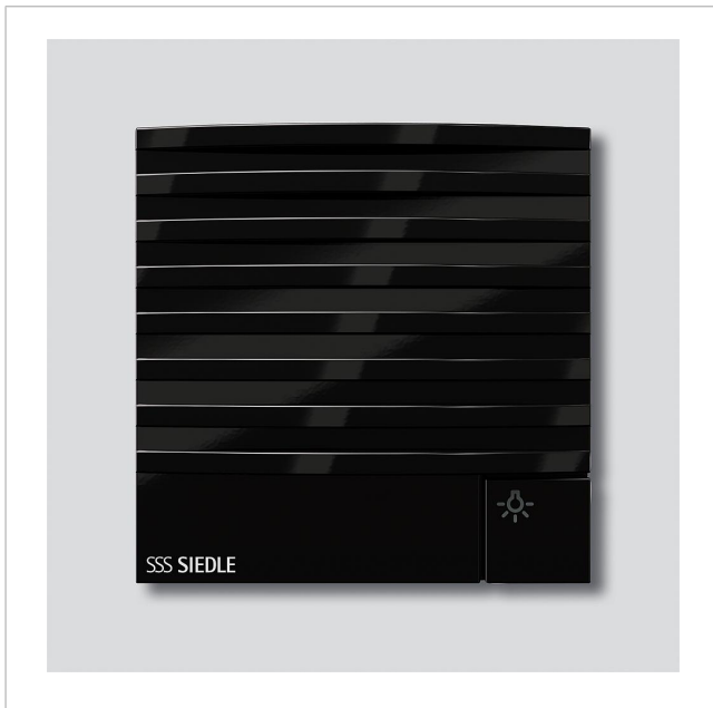
Access Module platine de rue ATLM 670-0 SH 200041805-00