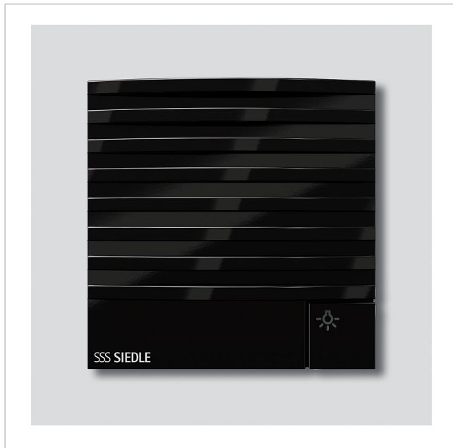
Access dørhøjtalermodul ATLM 670-0 SH 200041805-00