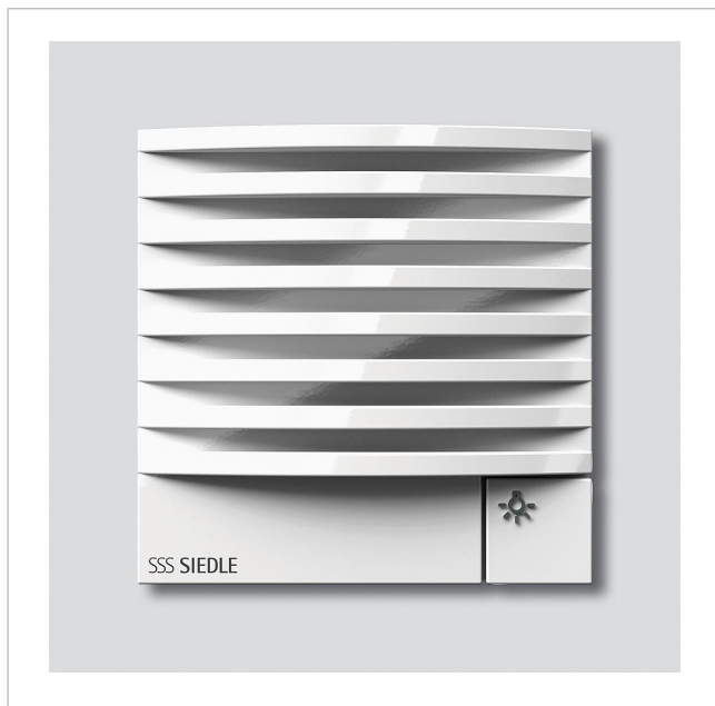
Access dörrhögtalarmodul ATLM 670-0 WH 200041804-00