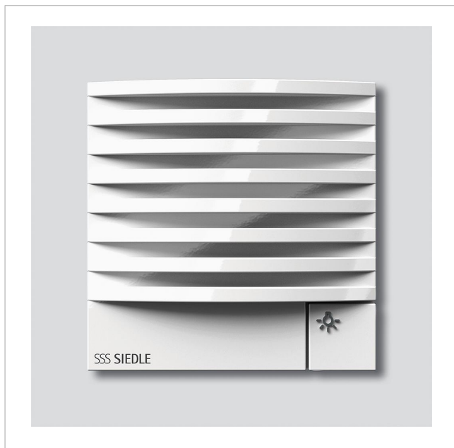
Access Module platine de rue ATLM 670-0 WH 200041804-00