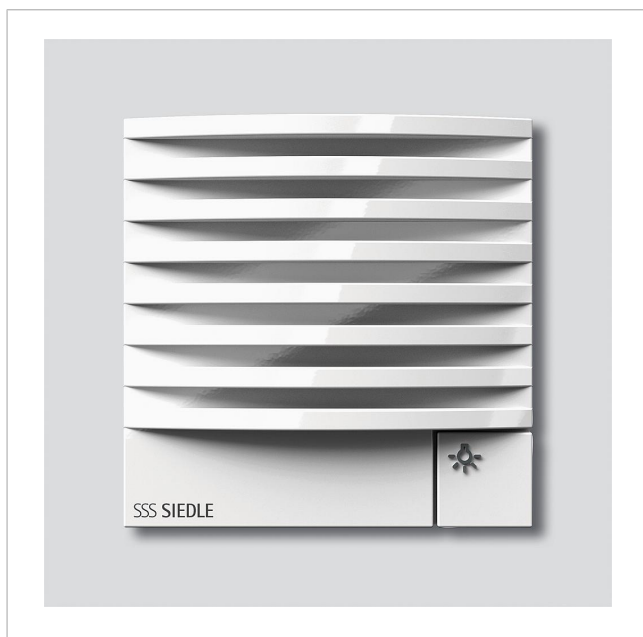
Access dørhøjtalermodul ATLM 670-0 WH 200041804-00