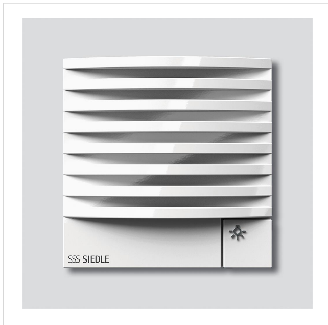
Access dørhøjtalermodul ATLM 670-0 WH 200041804-00