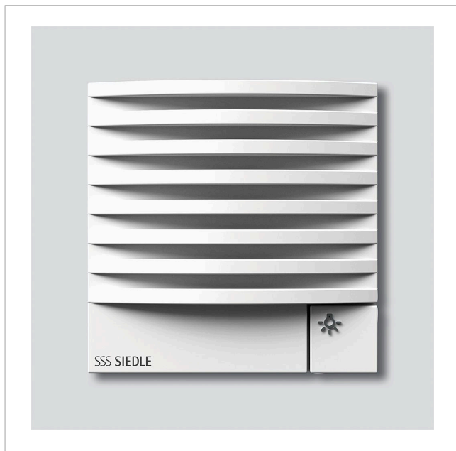
Access dørhøjtalermodul ATLM 670-0 W 200041755-00