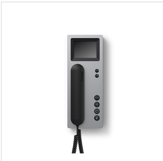
Bus-telefon Standard med färgmonitor BTSV 850-03 A/S